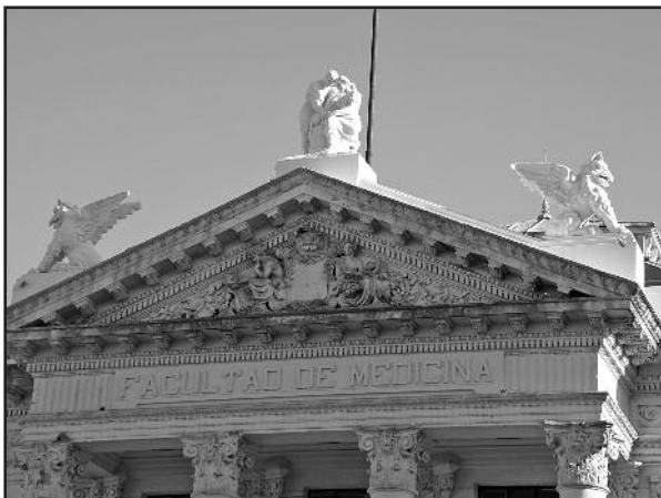
Figura 1. Grifos en la fachada de la Facultad de Ciencias Médicas (Rosario, Argentina).