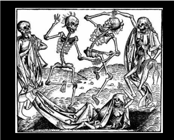
Figura 3. Totentanz (grabado alemán de 1493).