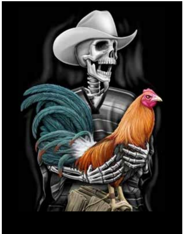
Figura 6. Lidiador de gallos, por David González.