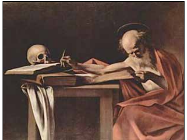
Figura 2. San Jerónimo, por Caravaggio.

Jacopo Ligozzi, nacido en Verona, llegó a ser pintor de la corte de los Medici en Florencia entre fines del siglo XVI y comienzos del XVII. Era muy devoto y,