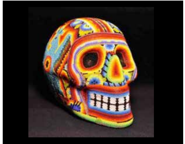
Figura 5. Calavera policroma con abalorios, arte huichol (México y sudoeste de los Estados Unidos).