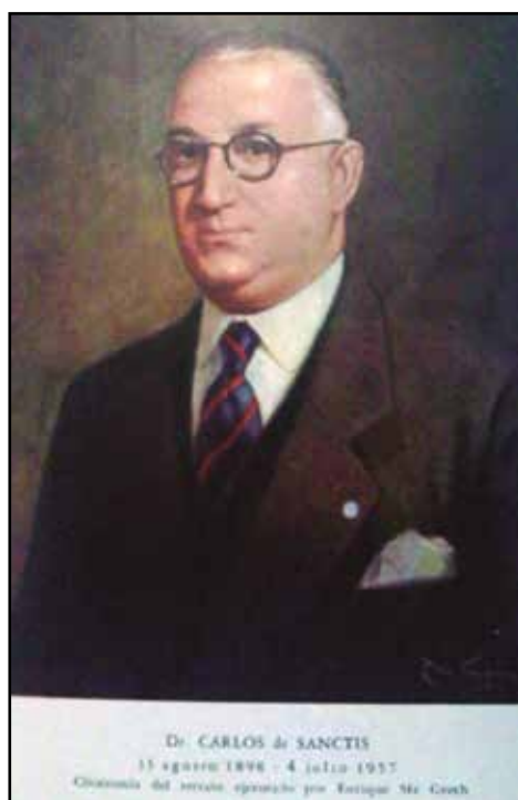
Figura 4. Retrato de Carlos de Sanctis, por Enrique McGrech.

Se reproduce el retrato de Carlos de Sanctis que hizo el famoso pintor Enrique McGrech (Figura 4).